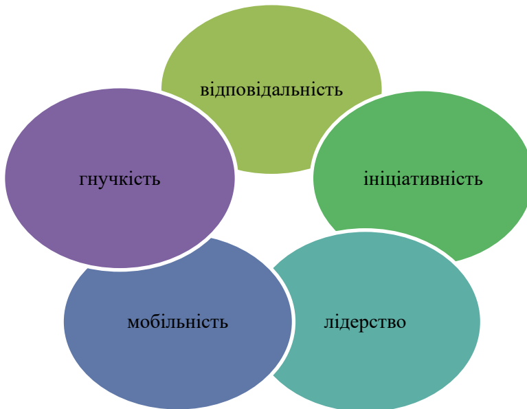
Рис. 2. Гуманітарні характеристики членів суспільства